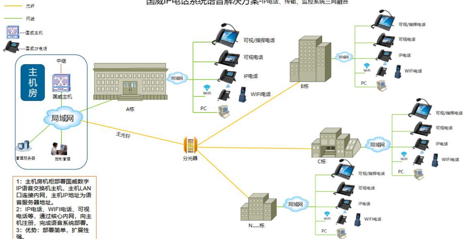
国威IP电话系统语音解决方案-IP电话、传输、监控系统三网融合